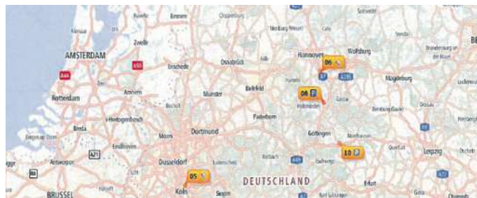
Am Bildschirm europaweit die Flotte im Blick: Die Karte zeigt den Standort der Fahrzeuge.

Dabei vermeidet Gö Sped das Umladen jeglicher Warengruppen so weit wie möglich. Ergebnis: „Wir sorgen für eine hohe Warensicherheit durch diese Direktpartien und für die Überwachung der Fahrzeuge mittels GPS“, sagt Zeise. Somit kann die Sendung zum pünktlichen Ein-